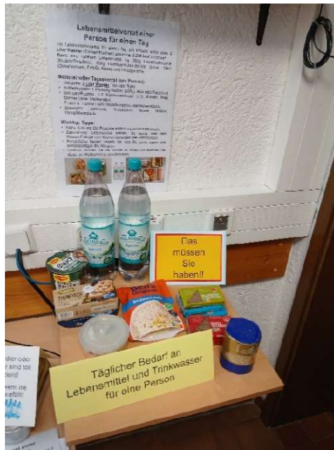
Bild 34: Der Trinkwasser- und Lebensmittelbedarf einer Person für einen Tag.