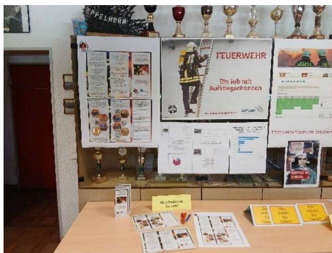
Bild 51: Werbung in eigener Sache. Kommen Sie zur Feuerwehr und machen Sie aktiv mit! Weiter ein Hinweis in eigener Sache. Werden Sie Mitglied in unserem Förderverein. Jetzt schon, „Vielen Dank!!“