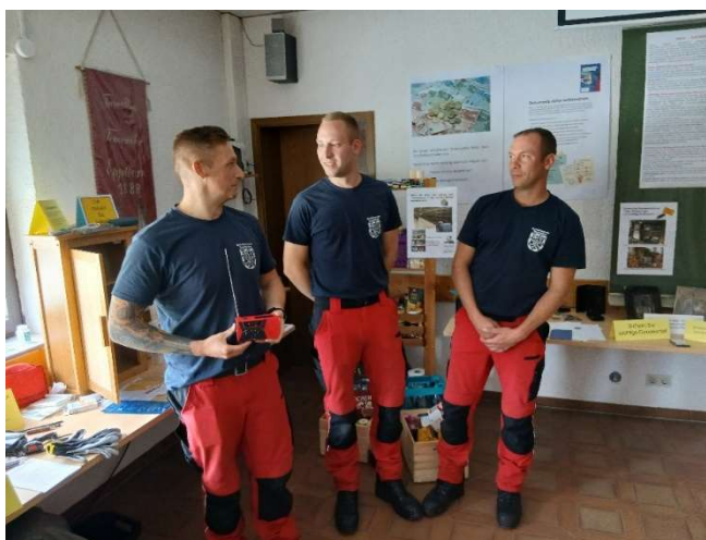
Bild 24: Besuch von Mitgliedern der Höhenrettungsgruppe der Berufsfeuerwehr Saarbrücken.