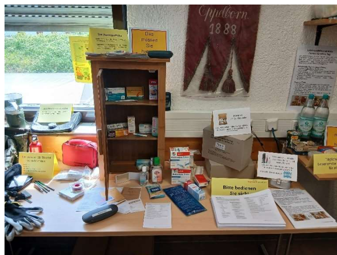
Bild 36: ..... bitte den Arzt/Ärztin oder Apotheker/Apothekerin über die individuelle Zusammensetzung befragen.