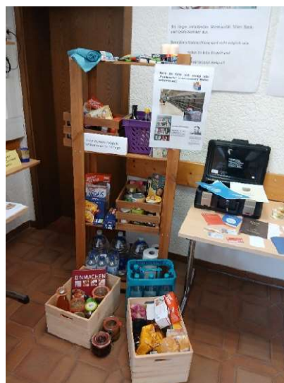
Bild 33: Optimal ist der Lebensmittel- und Trinkwasservorrat für 10 Tage (wenn möglich).