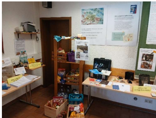
Bild 32: Selbstvorsorge, der eigene Vorrat an Lebensmittel, Trinkwasser, Batterien, Hygieneartikel, usw. .