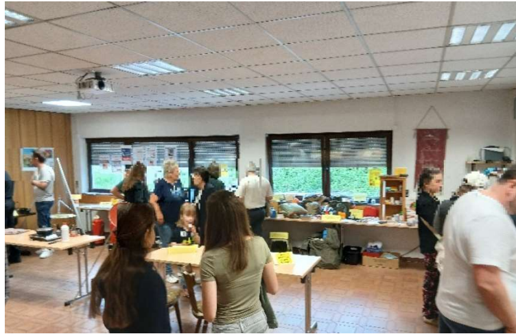
Bild 4: Besucher der Ausstellung an verschiedenen Stationen (Bild verpixelt).