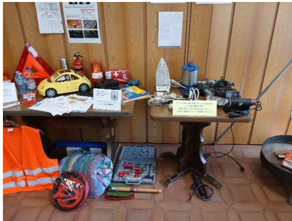
Bild 43: Die Stationen Elektrogeräte und Sicherheit rund um das Auto.