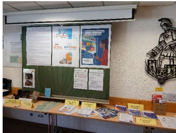
Bild 29: Informationen des Bundesamtes für Bevölkerungsschutz und Katastrophenschutz BBK.