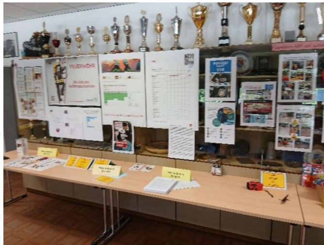
Bild 50: Statistik über die Feuerwehr. Einsatzaufkommen, Brandvorkommen, Ansehen der Bevölkerung in der Bevölkerung.