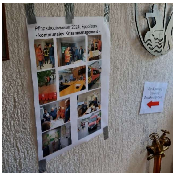
Bild 57: Das kommunale Krisenmanagement am schlimmen Pfingsthochwasser 2024 war auch Themenpunkt der Ausstellung.