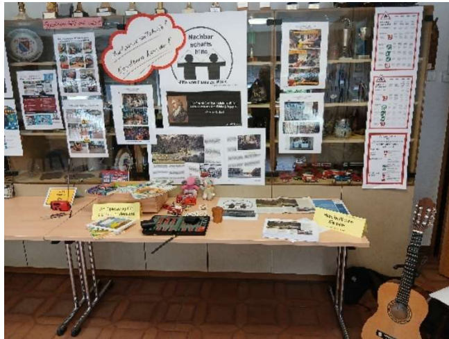
Bild 49: Nachbarschaftshilfe. Unverzichtbar in der Krise und wichtiger Bestandteil der Selbsthilfe.