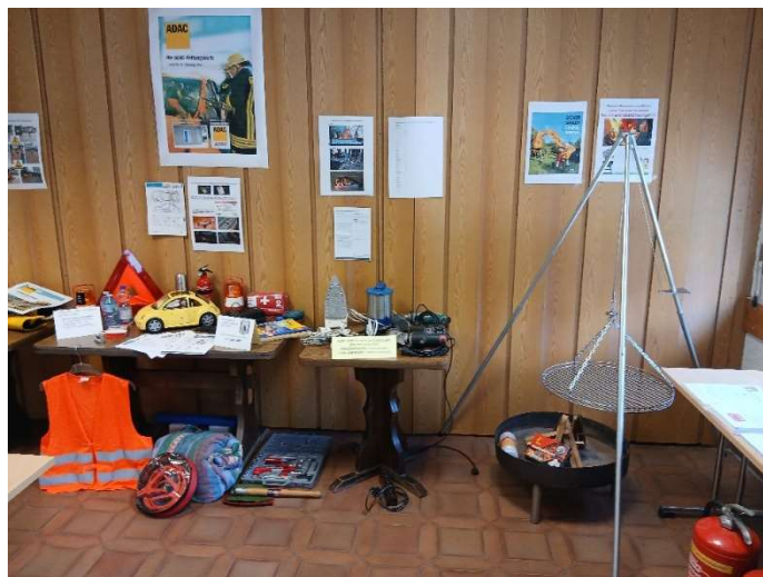
Bild 42: Achtung beim Grillen und Schwenken, kein Brandbeschleuniger (Spiritus) ins Grillfeuer schütten.