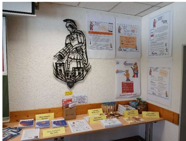
Bild 26: Die Stationen der Ausstellung; hier Infos für Kinder und Jugendliche .....