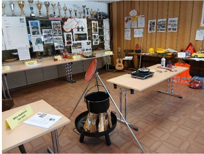
Bild 52: Blick in unsere Ausstellung. Das Erbsensuppenrezept auf dem Feuer wurde sehr gerne mitgenommen.