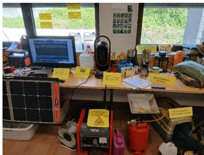
Bild 39: Tipps und Infos, wenn die Strom-, Gas-, Trinkwasserversorgung, Fernmelde-, Internet- und Kabelverbindung oder das Mobilfunknetz ausfällt.