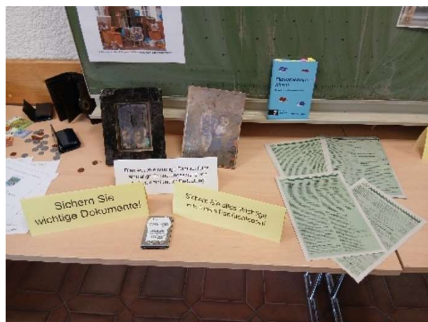
Bild 30: Schreckliche Realität, der Verlust von persönlicher Erinnerung nach Brand- oder Hochwasserlagen.