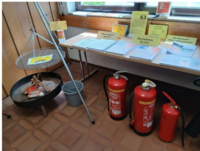
Bild 41: Tipps und Infos zu Rauch-, CO-, Wärmemelder und über Feuerlöschertypen.