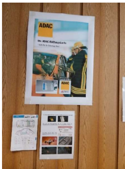
Bild 45: Unverzichtbarer Helfer bei Verkehrsunfällen, die Rettungskarte des individuellen Fahrzeugtyps unter der Fahrer-Sonnenblende.