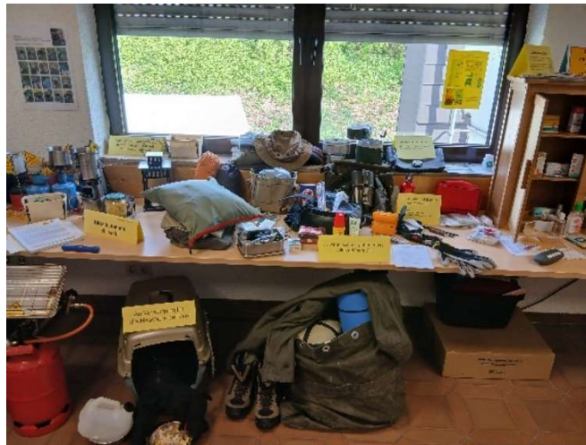
Bild 37: Das Notgepäck. Was sollte man mitnehmen, wenn schnell die Wohnung verlassen werden muss?