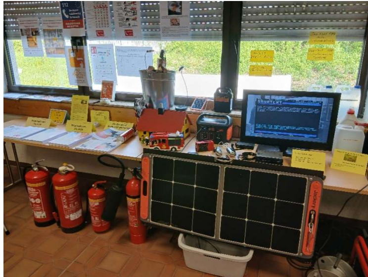
Bild 40: Kleine Helfer, Solarsysteme. Eine große Info-Station galt dem Brandschutz.