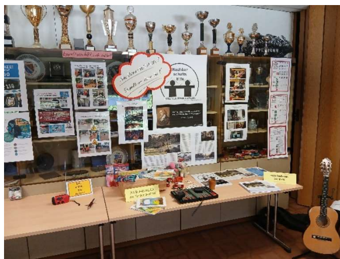
Bild 48: Wenn die Krise da ist. Berichte über den großflächigen Stromausfall in Berlin im Januar 2026.