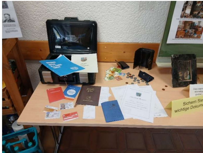
Bild 31: Tipps und Hinweise zum Sichern von wichtigen Dokumenten.