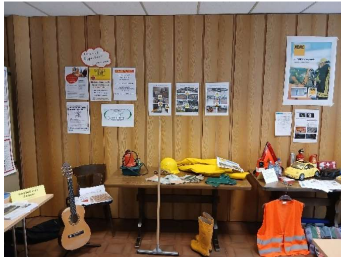
Bild 46: Sicherheitshinweise bei Hochwasser- und Sturmereignissen.