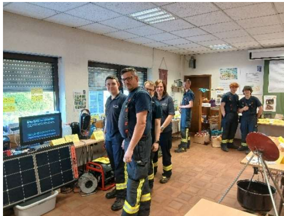
Bild 20: Kameradinnen und Kameraden aus allen Löschbezirken in Eppelborn besuchten die Ausstellung, hier aus Dirmingen.