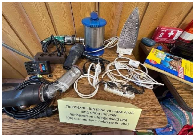
Bild 44: Brandursache Nr. 1 in Deutschland sind defekte Elektrogeräte.