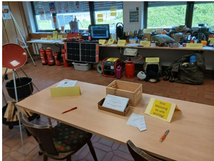
Bild 53: Ihre Meinungen zur Ausstellung und Ihre Anregungen waren uns wichtig!